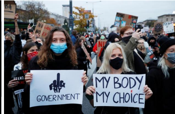
Protestnici na Poljskem.