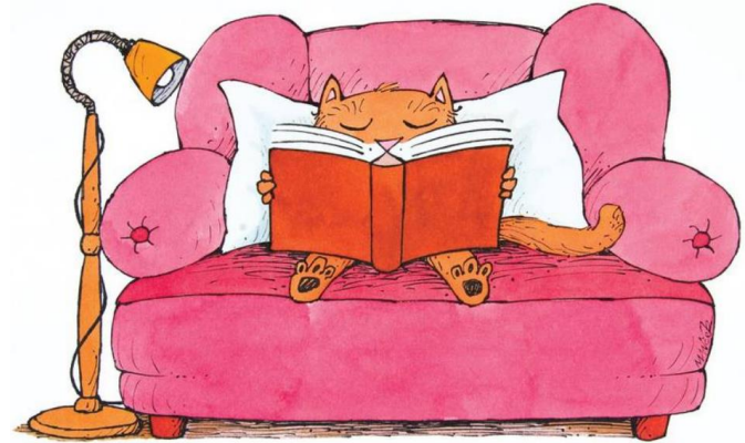
Ilustracija: Marjan Manček