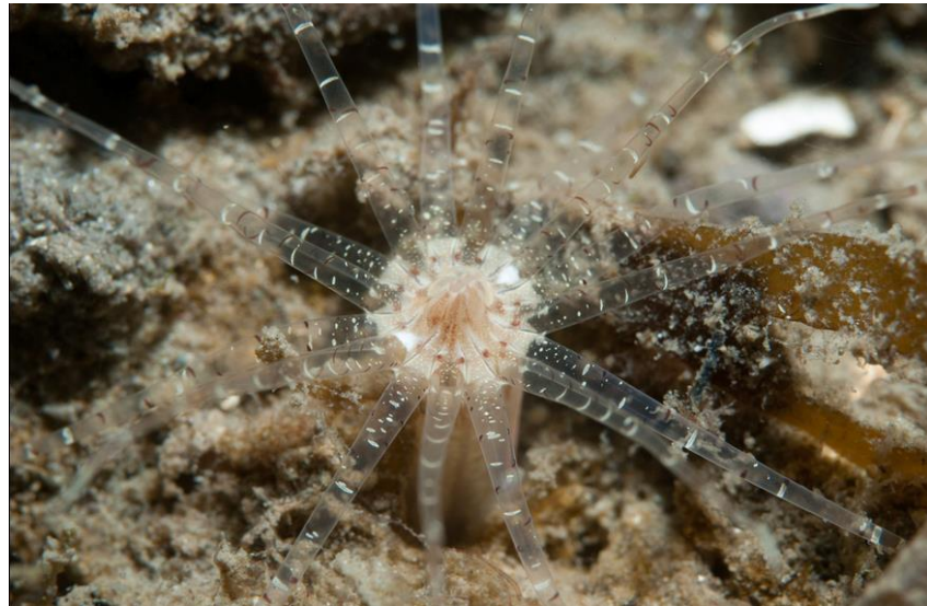
Morska vetrnica Edwardsia delapiae .