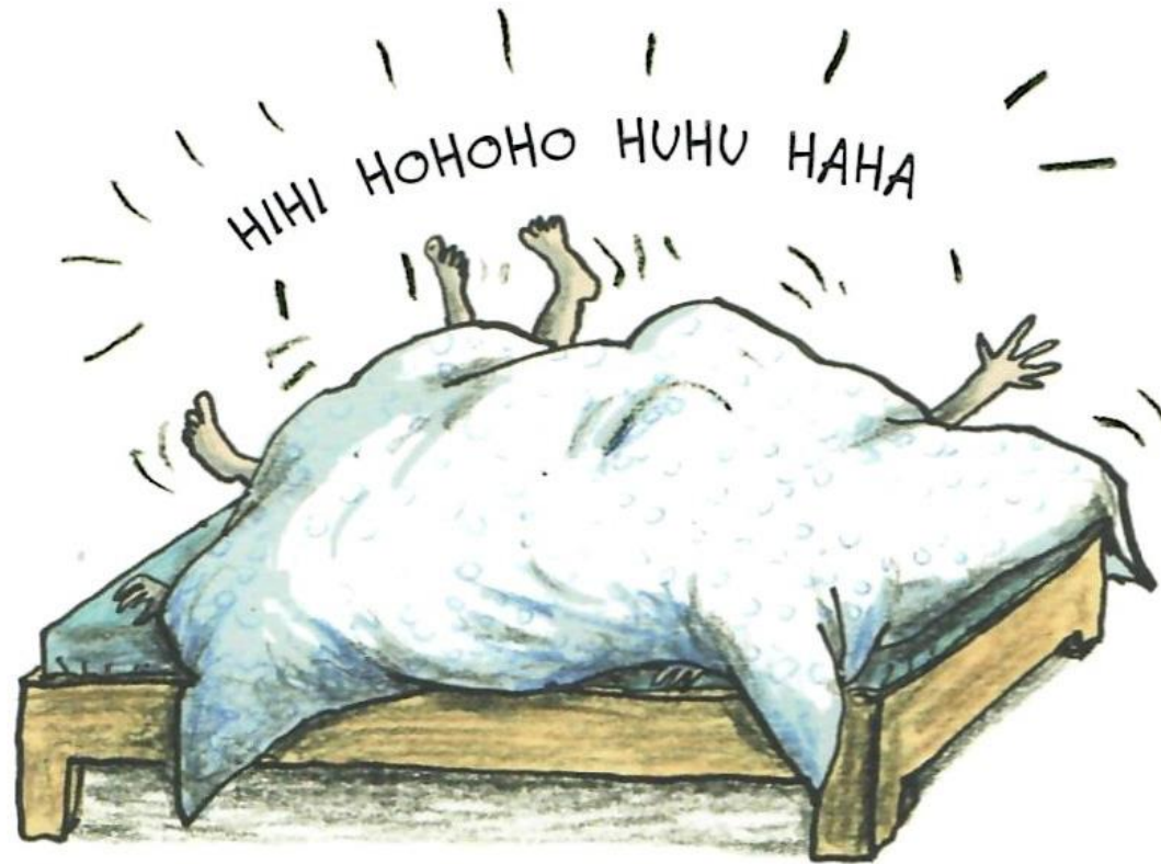
Avtorica ilustracij: Anke Kuhl