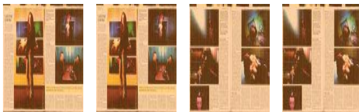
LASTNA IZBIRA MLADINA 41 15. 10. 2010

Stran: 53, 52, 54, 55 Rubrika: / Žanr: poročilo Površina članka: 2492 cm 2