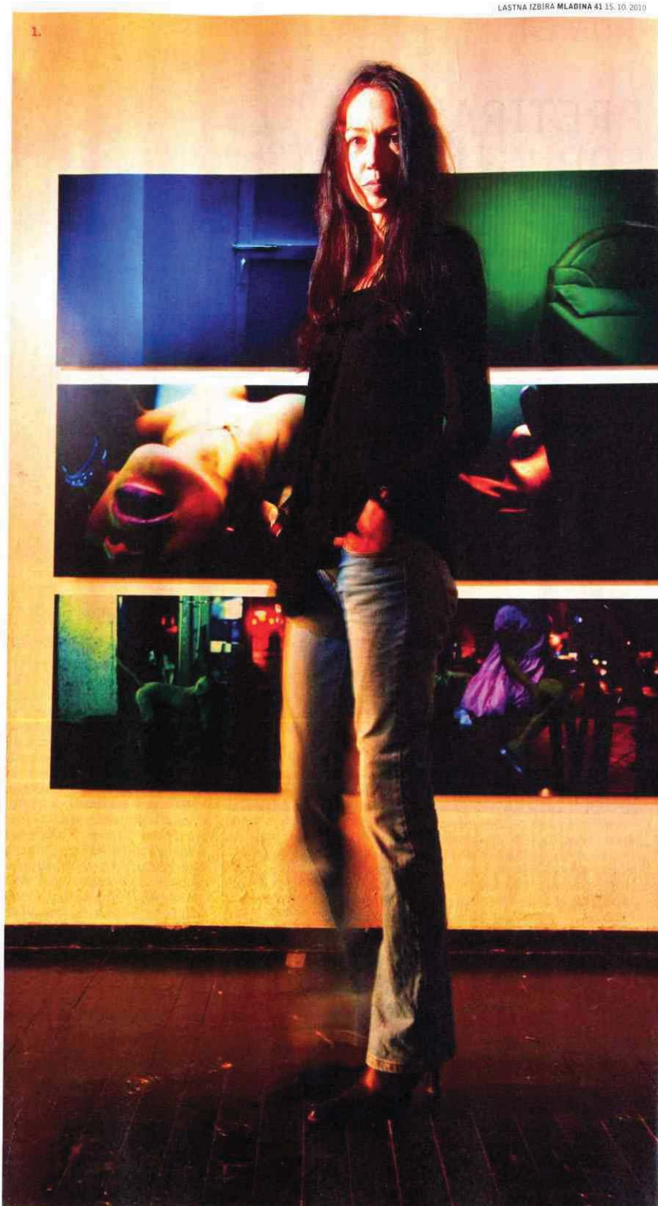
LASTNA IZBIRA MLADINA 41 15. 10. 2010